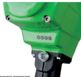
Светодиодный индикатор перегрузок