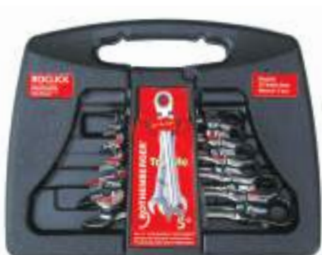
Набор ключей ROCLICK № 70490