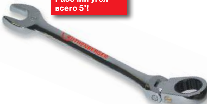
Рабочий угол 5°