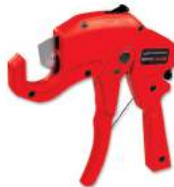
№ 55005 / № 55015