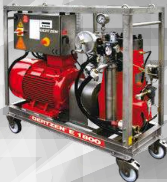
OERTZEN E 1800

Самые мощные электронасосные агрегаты сверхвысокого давления с максимальным рабочим давлением 2500 бар.