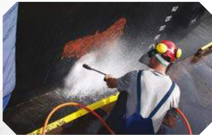
Чистка корпуса судна