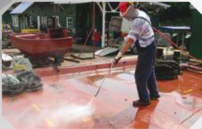
Чистка палубы судна