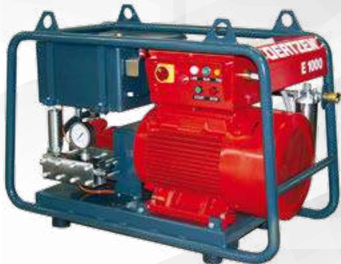
OERTZEN E 1000