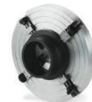
№ 55447 (Дополнительные принадлежности)