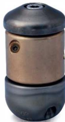
1309 | 1310