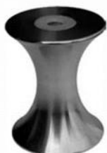
1605 AL | 1609 AL

Роликовые устройства предназначены для направления и безопасного использования шлангов высокого давления (в качестве защиты от переламывания и истирания). Роликовые устройства для направления шланга с артикульными номерами 1600, 1601, 1602 и 1620 поставляются с алюминиевыми роликами и шарикоподшипниками из нержавеющей стали VA. На заказ возможно изготовление с пластмассовыми роликами.