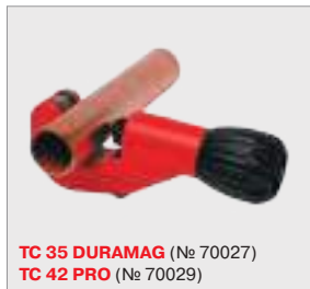
TC 35 DURAMAG (№ 70027) TC 42 PRO (№ 70029)