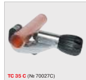
TC 35 C (№ 70027C)