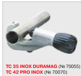
TC 35 INOX DURAMAG (№ 70055) TC 42 PRO INOX (№ 70070)