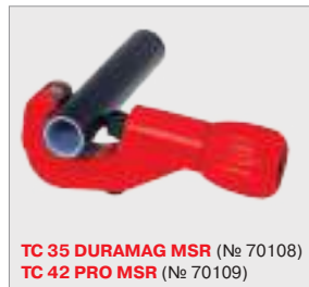
TC 35 DURAMAG MSR (№ 70108) TC 42 PRO MSR (№ 70109)