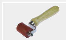
130.611 Силиконовый прикаточный ролик 40 мм