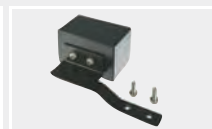
127.825 Груз с ручкой в сборе для foiler