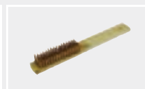
130.612 Латунная щётка