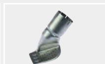
123.663 Насадка для foiler на шов 30 мм