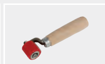
130.146 Силиконовый прикаточный ролик 30 мм