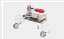
159.531 Подъёмное устройство