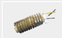
119.654 Нагревательный элемент для Weldy Plus