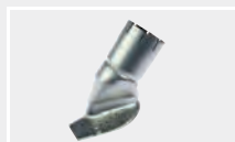
123.627 Насадка для foiler на шов 20 мм