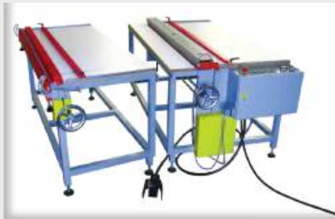
Ручная гибочная машина