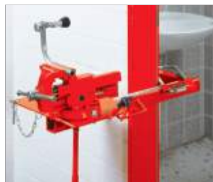
Параллельные тиски (№ 070705X) и поворотный диск не входят в комплект