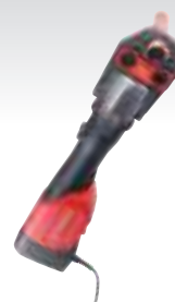
ROMAX 3000 AC