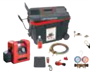
ROCADDY 120 R32 аналоговый