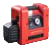
ROAIRVAC R32 1.5