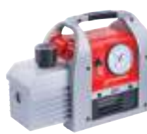
ROAIRVAC R32 6.0