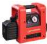
ROAIRVAC R32 3.0