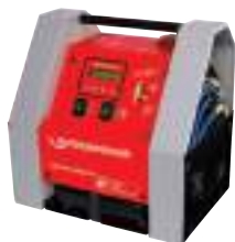
ROKLIMA MULTI 4F