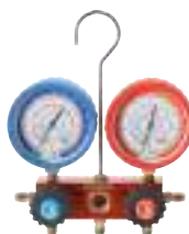
Двух- и четырёх- позиционные коллекторы, соединение 5/16"