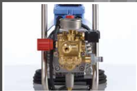
Рисунки: HD 7/122 TS

Снижает шумообразование и износ (HD 7/122 TS)